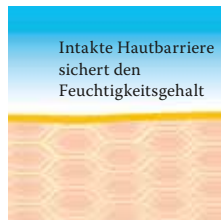
Intakte, schützende Hautbarriere mit Linol-säure-reichen Lipiden.

Besuchen Sie uns unter www.linola.de . Denn dort haben wir für Sie alle aktuellen Informationen über Linola Hautmilch , Linola Gesicht , Linola Hand und Linola Fuß-Milch sowie zu weiteren Linola-Produkten bei verschiedenen Hautproblemen bereitgestellt.