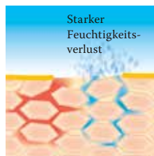
Lipidverlust führt zu einer gestörten Hautbarriere: Die Haut verliert viel Wasser und trocknet aus.